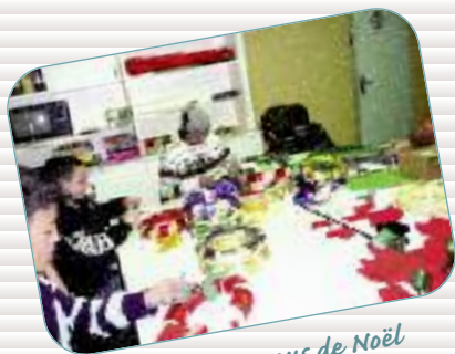
Les rendez-vous de Noël Décoration des halls, atelier du Père Noël... 520 personnes se retrouvent à l'occasion des fêtes de fin d'année.