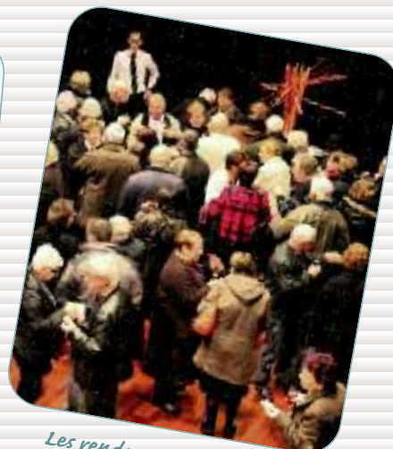
Les rendez-vous Aiguillon Le temps d'une soirée, Aiguillon réunit 437 habitants qui, par leurs initiatives, participent au « bien vivre ensemble ».