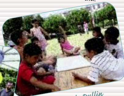
Estivales de Dullin Des activités sont proposées aux habitants tout au long de l'été en bas des immeubles, square Charles Dullin quartier des Champs Manceaux à Rennes.