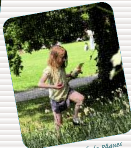
Chasse aux œufs de Pâques Evènement incontournable pour les enfants, des chasses aux œufs de Pâques sont organisées sur le patrimoine.