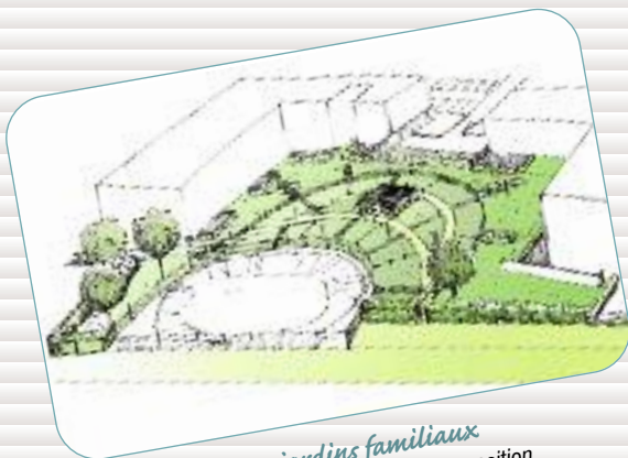
Les jardins familiaux

Encadré par des animateurs, des jeunes financent leur projet collectif en effectuant des travaux d'embellissement sur des groupes d'habitation.