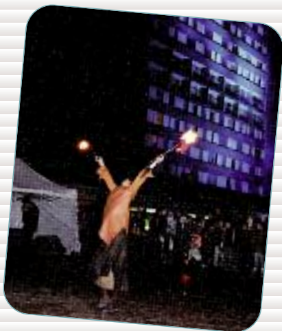
Sarah Bernhardt en fête Un temps fort au pied de l'immeuble de Sarah Bernhardt, quartier des Champs Manceaux à Rennes, pour fêter Noël.