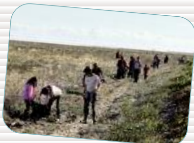
I love ma planète 175 personnes sont parties tôt le matin de Brest, Nantes, Rennes et St-Malo pour une journée conviviale de sensibilisation à la fragilité d'un site exceptionnel : la Baie du Mont Saint Michel.