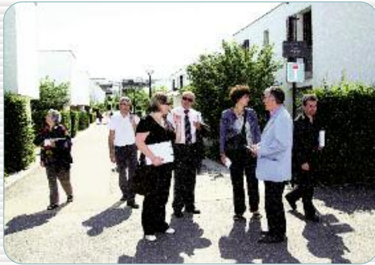
Rendez-vous en marchant

Le principe est simple et très enrichissant : faire le tour d'un quartier à pied et confronter les points de vue des 73 participants sur le cadre de vie et son amélioration.