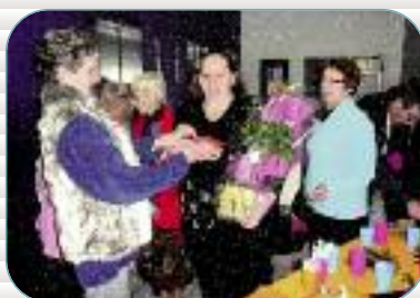
Les rendez-vous de la propreté Sur 24 sites, les habitants sont venus partager un café avec le préposé au nettoyage, moment privilégié pour échanger sur le respect de la propreté.