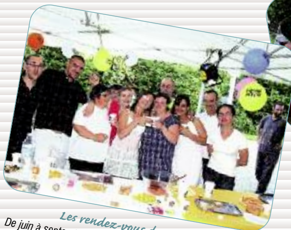
Les rendez-vous des voisins De juin à septembre, les habitants sont invités à se retrouver autour d'un bon repas, l'occasion pour 1000 personnes de partager un moment de convivialité.