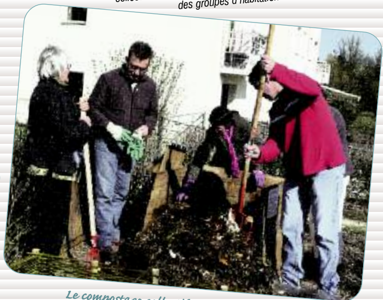
Le compostage collectif en pied d'immeuble

18 parcelles seront mises à disposition des 56 familles à la Chapelle des Fougeretz.