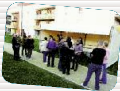
Les crémaillères Initié en 2010, ce nouveau rendez-vous permet aux habitants de faire connaissance suite à leur emménagement dans un immeuble neuf.