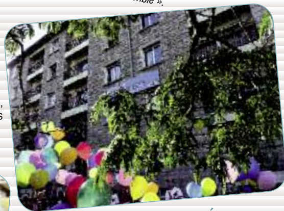
Les 50 ans de Paramé 500 ballons partent dans les airs pour symboliser les 50 ans de 3 immeubles de St Malo.