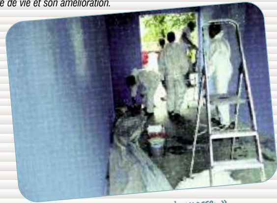
Ateliers « citoyen-jeunesse »

Chaque année depuis 13 ans, des habitants bénévoles organisent une braderie rue Courbet à Morlaix.