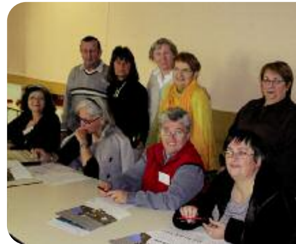
Rencontre entre Habitants Relais