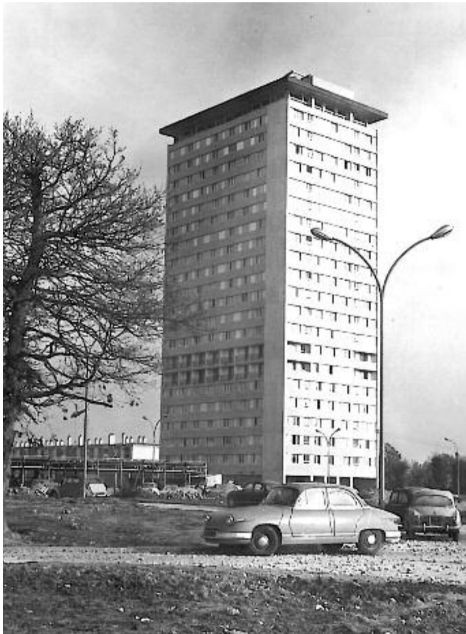
Résidence Sarah Bernhardt - Rennes